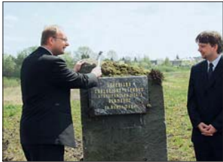
Ministr životního prostředí Libor Ambrozek (vlevo) poklepává základní kámen nového ekologického objektu v Horce nad Moravou.