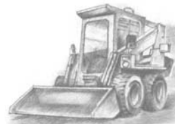
Ilustrace: J. Hasišková

V případě zájmu o kteroukoli službu kontaktujte obchodní úsek společnosti tel. 585 411 524 nebo 585 413 323, e-mail: tsmo@tsmo.cz